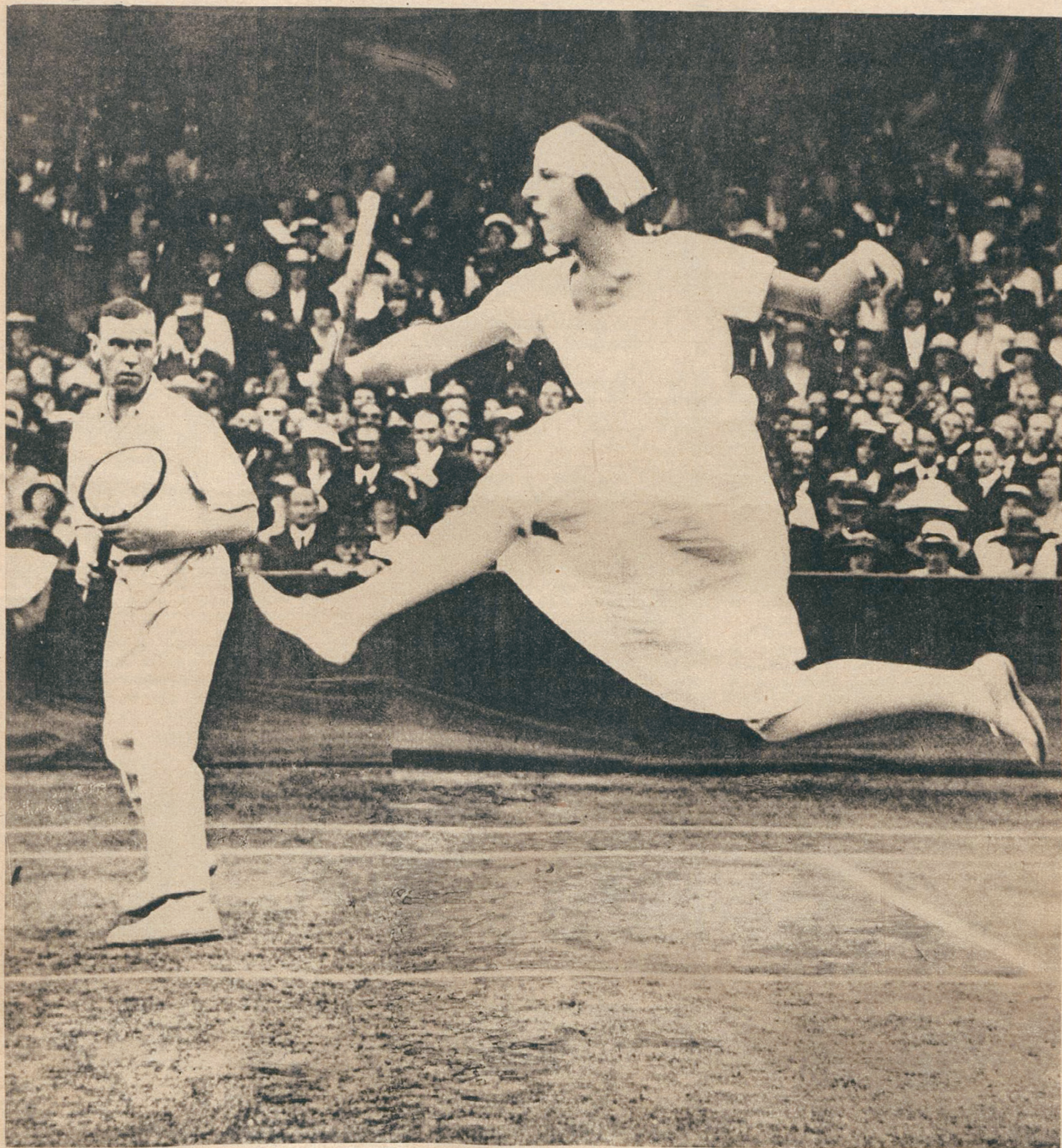
M lle SUZANNE LENGLEN GAGNANT LE DOUBLE MIXTE AVEC L'AMÉRICAIN PATTERSON, A WIMBLEDON Déjà victorieuse dans le championnat simple dames, la jeune joueuse française a gagné avec miss Ryan le double dames, battant Mrs Lambert Chambers et Larcombe par 6-4, 6-0 et avec Patterson le double mixte, battant Lycett et miss Ryan, par 7-5, 6-8.

■■■■■■■■■■ PUBLICATION HEBDOMADAIRE ILLUSTRÉE, 18, RUE D'ENGHIEN, PARIS ■■■■■■■■■■