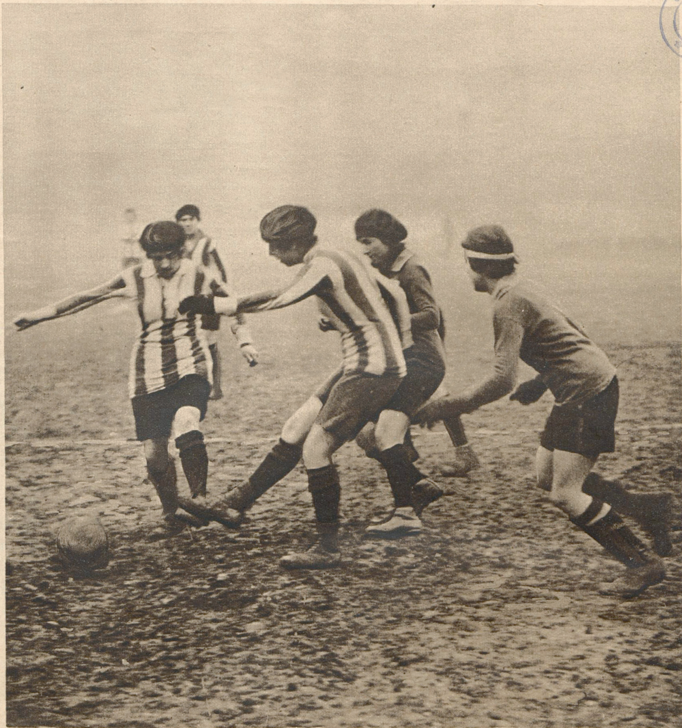
UN MATCH DE FOOTBAAL ASSOCIATION ENTRE "FEMINA-SPORT" ET "ACADEMIA"

LE MIROIR paie n'importe quel prix les documents photographiques d'un intérêt particulier.